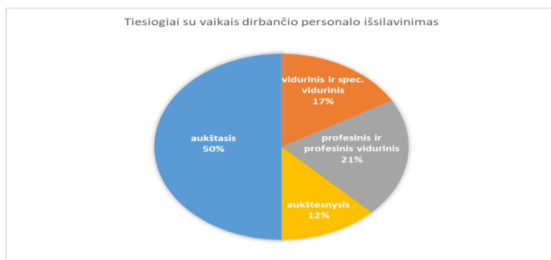
1 pav. Tiesiogiai su vaikais dirbančio personalo išsilavinimas

Vaikų globos padalinio personalas. Institucijoje suformuota tokia personalo struktūra, kuri užtikrintų paslaugų kokybę, tenkintų vaikų poreikius, leistų siekti įstaigos tikslų. Įstaigoje yra 43,25 pareigybės: tiesiogiai su vaiku dirbantys specialistai užima 27,5 pareigybės, netiesiogiai su vaiku dirbantys 15,75 pareigybės. Pusė tiesiogiai su vaiku dirbančio personalo turi aukštąjį išsilavinimą (1 pav.). Darbuotojams 2019 m. sausio mėn. buvo nustatytos einamųjų metų veiklos užduotys.